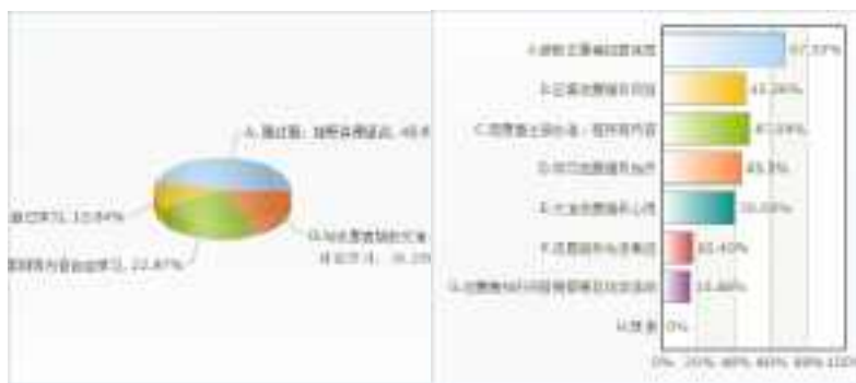
青年喜欢接受志愿服务培训的方式 青年希望通过新媒体得到的信息