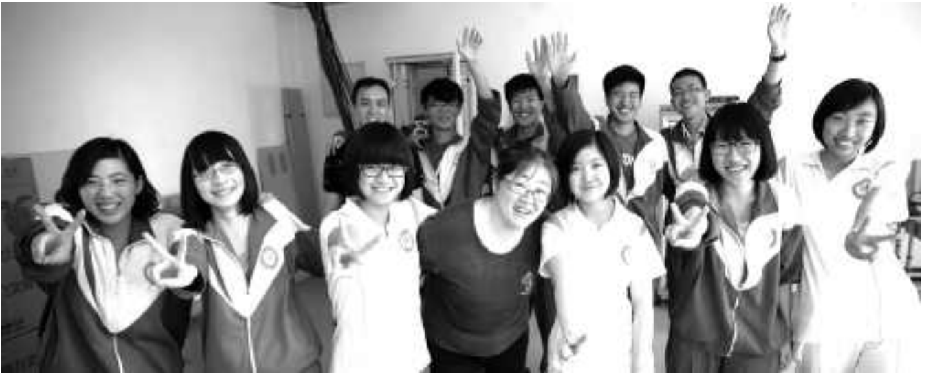
天津市第九中学青春校园广播站的幸福快乐播音员和指导教师