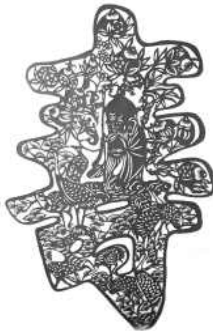
九九重阳节, 浓浓老人情 陕西剪纸