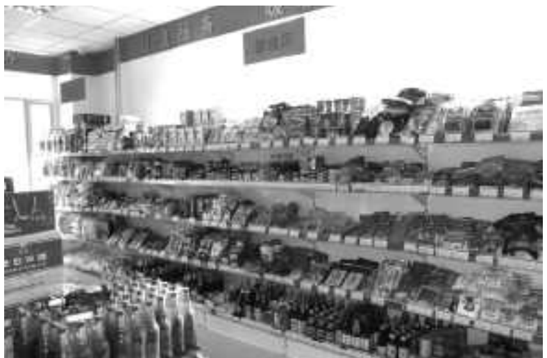
向阳路昔阳里社区超市