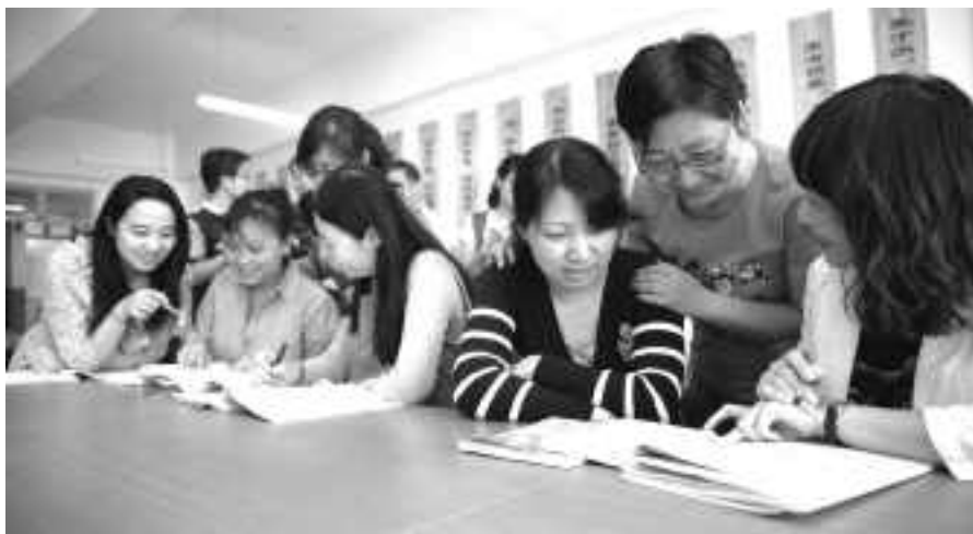
天津市第九中学的教师们在快乐阅读