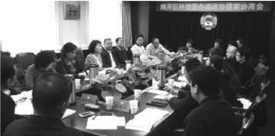
我区召开南开区科信委政协提案办理协商会