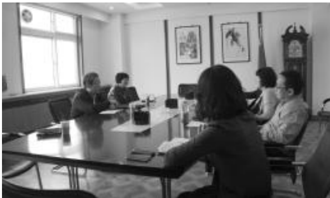
区委统战部领导到区教育局征求意见

研。在今年的党外代表人士教育培训中,将加强政治引导,有针对性地安排参政议政、经济管理、社会建设、民生改善、领导艺术等课程,采取课堂交流、实地参观、交流互访等实践形式,提高学习效果。对“进一步加强党外代表人士队伍建设”、“不断激发统一战线各领域工作活力”等问题,部门将分时段和年度认真总结分析以往工作经验,以“加强参政党队伍建设,发挥参政党作用”为着力点,不断加强参政议政平台建设,进一步巩固多党合作政治基础,推进新时期统战工作的持续发展。