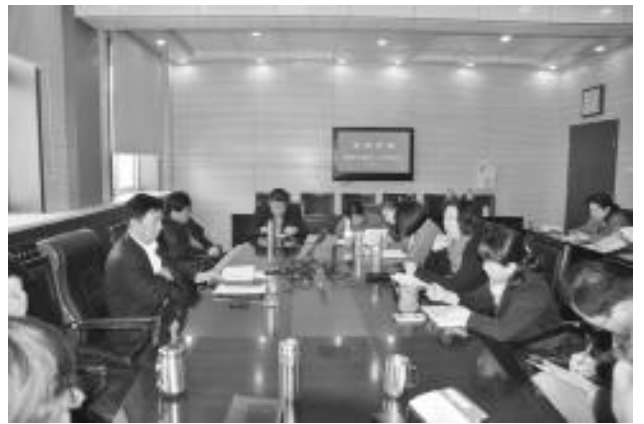
区委党校教职员工在集中学习

区委党校认真贯彻落实中央八项规定，坚决反对“四风”，坚持问题导向，深化学习教育，做到边学边查边改，实现了良好开局。