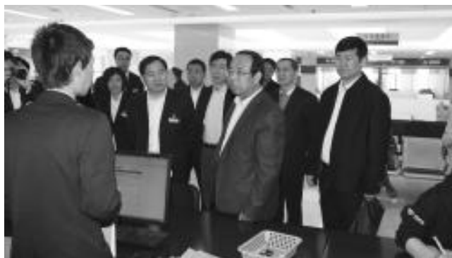
市督导组考察窗口干部服务内容

2.集中整治服务质量。在全市率先实行公共服务标准化建设,面向企业推出“四式”服务新举措,审批整体提速 12.5%。推行“一窗式”服务。设立企业联合审批平台,相关联审部门在一个窗口集中办公,形成了一窗统一接件、部门并行办理、效能限时监察,反馈考核评议四位一体高效办理机制。推行“全程式”服务。采取将企业注册所需填写的表格和所需复印的材料全部交由专人全程代办。推行“预约式”服务。将窗口首席代表电话通过电视、报纸等媒体平台向社会公开,实行 24 小时预约审批服务。今年已为 45 家企业提供预约审批。推行“专项定制”服务,为投资额 500 万元以上的企业,开通重大投资项目绿色通道,采取“一企一策”的方式,确保在 1 个工作日内完成审批。目前,已为天佑城、山东鲁能集团、红星美凯龙家具有限公司等 5 家企业提供服务,受到企业的一致好评。