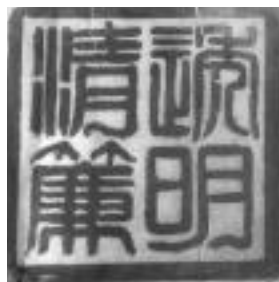
透明清廉 篆刻:陈兆瀛

2013 年,我们都是“梦之队”的成员,在民族复兴的路上,或大或小的放飞着自己的中国梦!